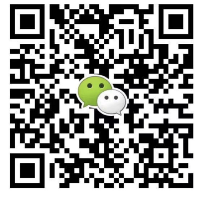
● 华北华东地区及海外咨询 滕老师