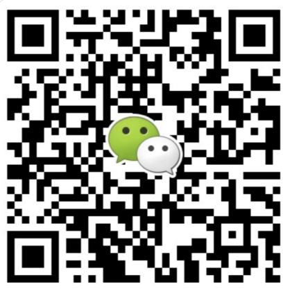
● 华南地区及海外咨询 叶老师