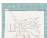
Make lines clearer