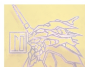
Paint it with color