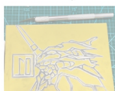
Carve the rubber