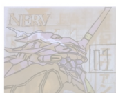
Sketch the pattern