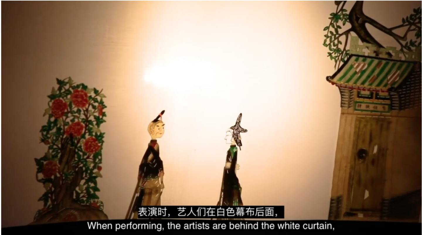
截图自Owen的皮影戏纪录片

第三步，文书写作。我早早就开始了文书的准备。因为看到自己在活动上逐渐取得了一些进展，我也逐渐找到信心和斗志，严格按照文书的安排每天马不停蹄地写着。