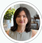
董洁 Jie Dong