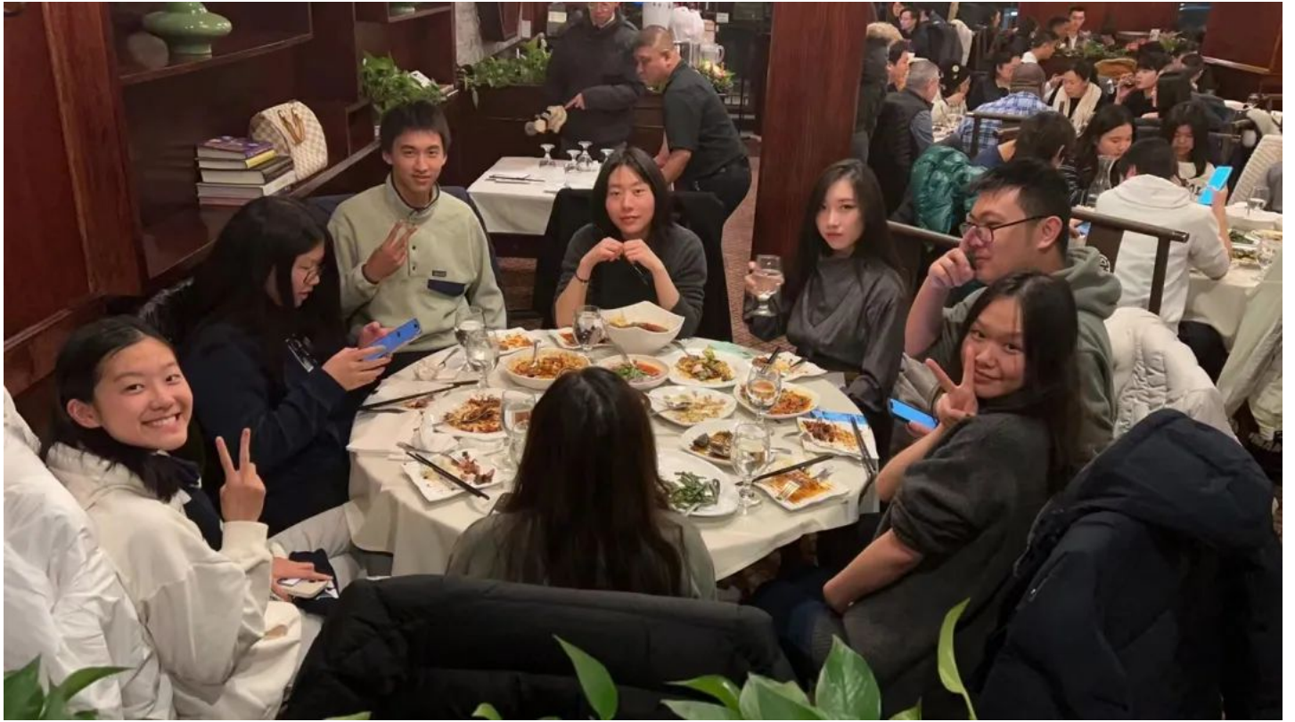
美食更是感恩节营的重要一环，注重营养搭配与学生口味的丰富餐食滋养了长期在“村里受苦”的孩子们的中国胃