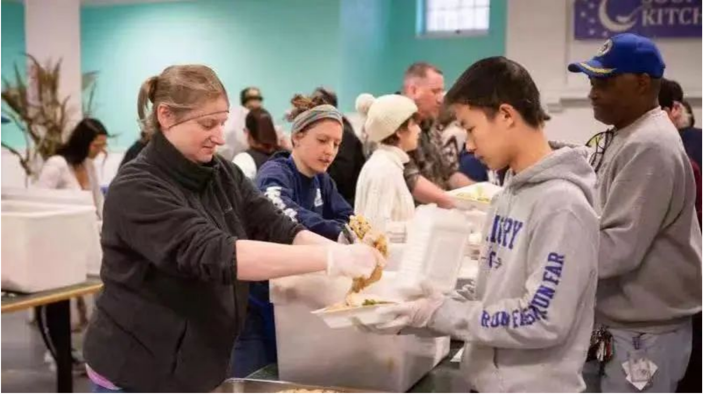
Ivy Labs总部位于耶鲁校园内，为参观大学实验、参与当地社区实践都带来了得天独厚的优势