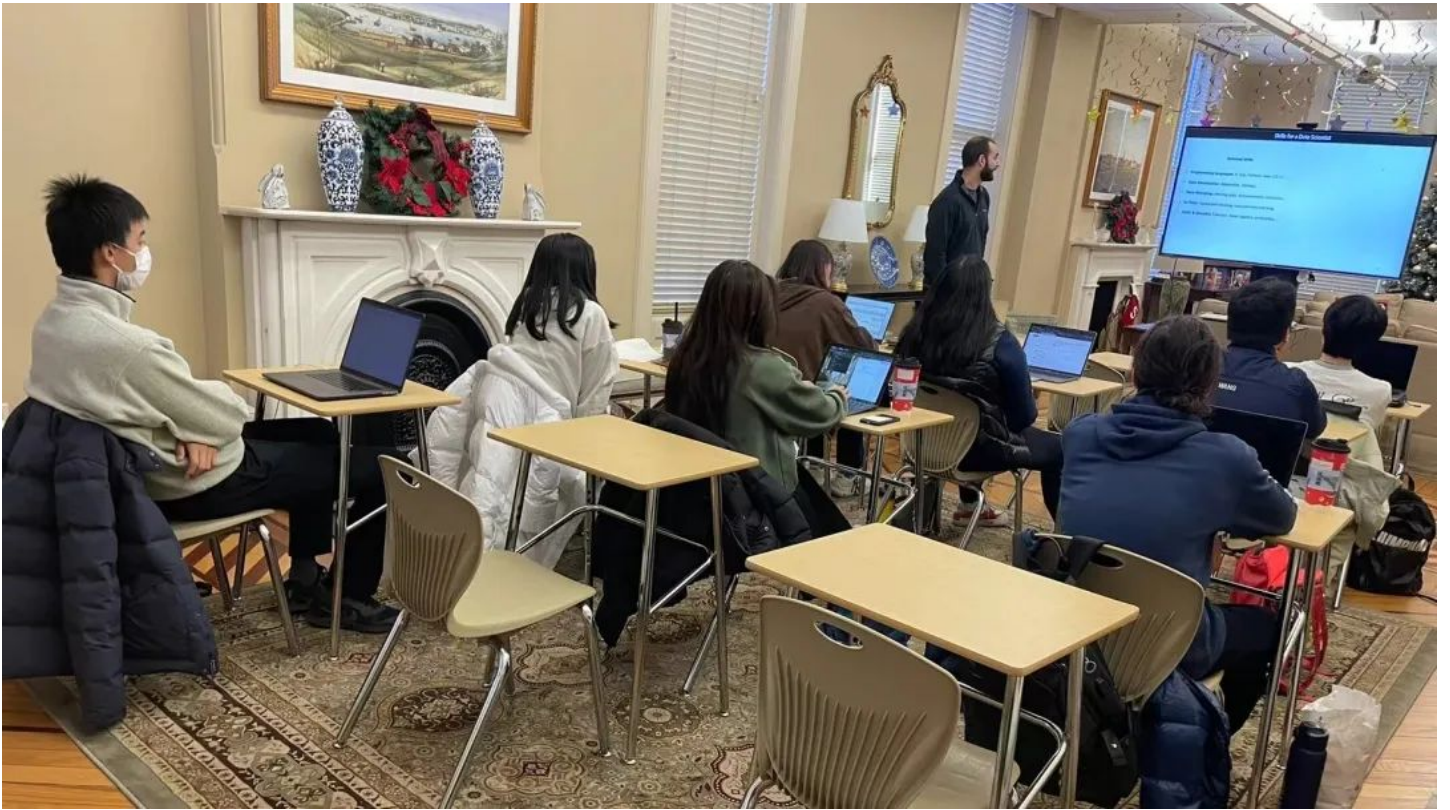
感恩节营设置的丰富课程，由一流师资任教，课堂内带领学生进行充分的讨论与知识拓展，为美高的学习奠定基础