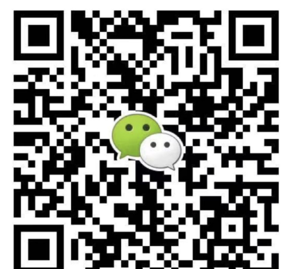
● 华北华东地区及海外咨询 滕老师