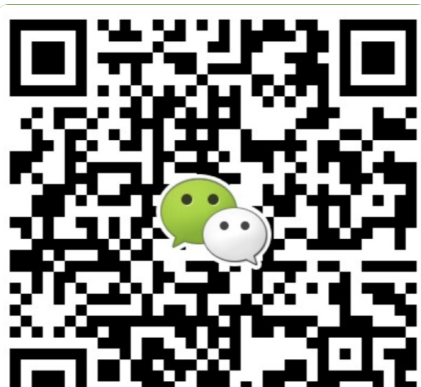
● 华南地区及海外咨询 叶老师