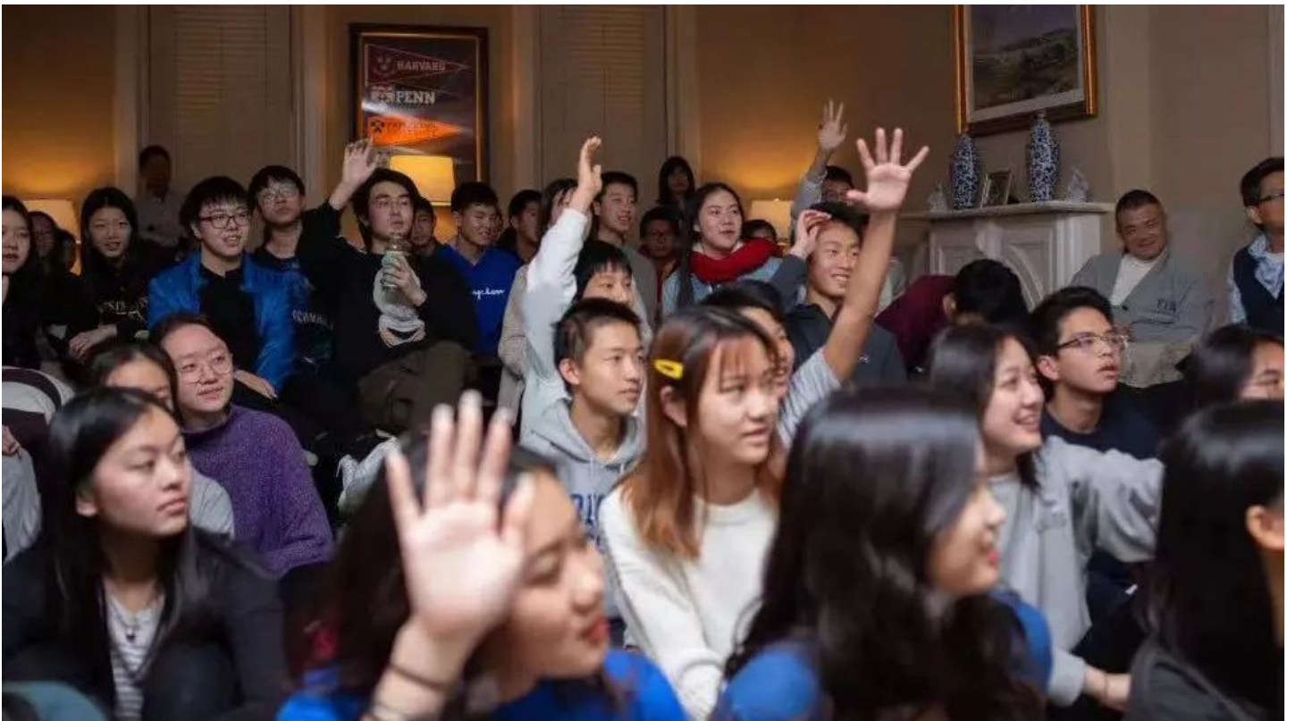
Talent show作为每年的保留项目成为许多孩子心中最美好的记忆，在这个过程中他们施展才华、认识彼此