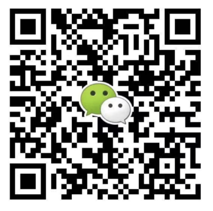
● 华北华东地区及海外咨询 滕老师