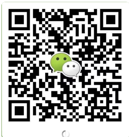
● 华北华东地区及海外咨询 滕老师