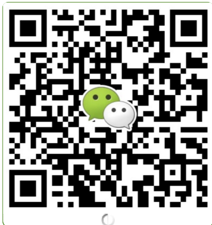
● 华南地区及海外咨询 叶老师