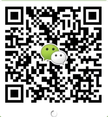
● 华北华东地区及海外咨询 滕老师