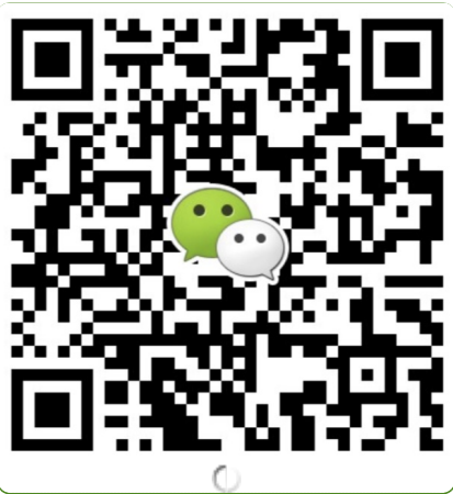
● 华南地区及海外咨询 叶老师