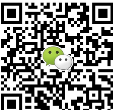
● 华南地区及海外咨询 叶老师