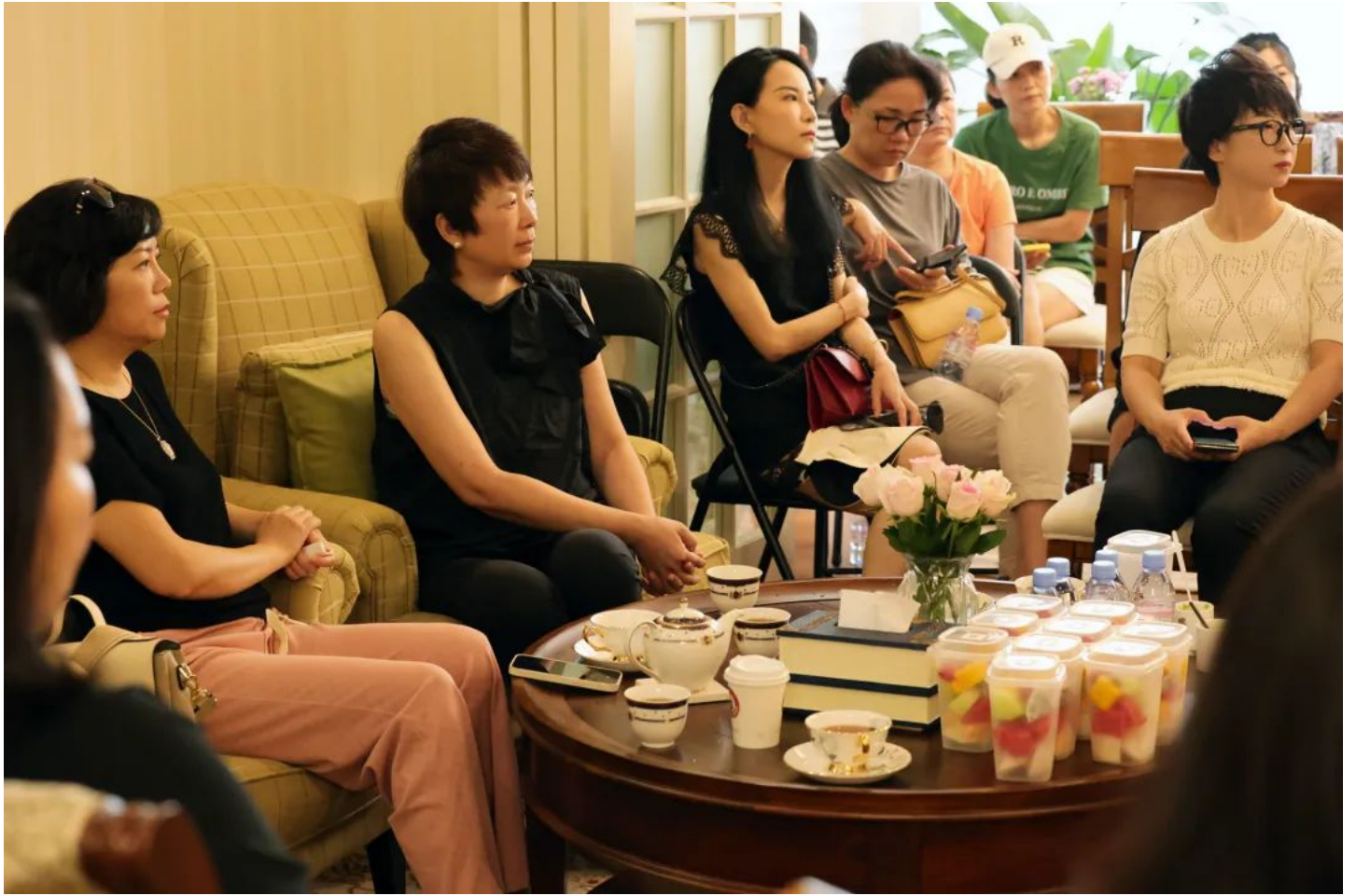
Ivy Labs深圳办公室五周年茶叙会上座无虚席，现场温馨的气氛感染着每一个人。