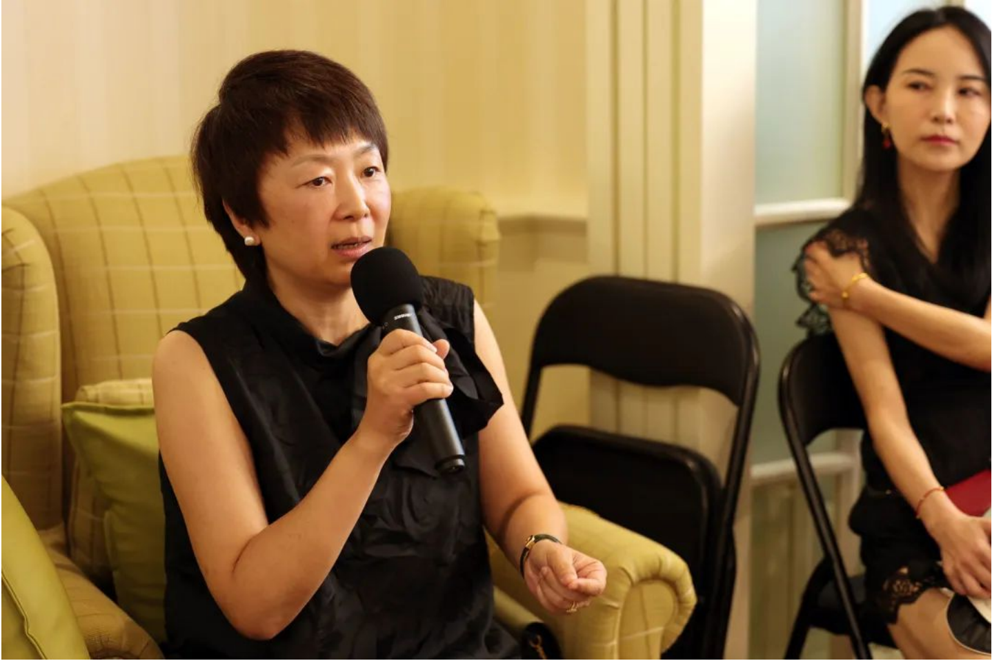
Alice妈妈：密歇根大学安娜堡分校的就读体验