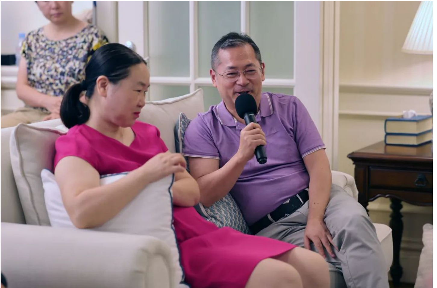
Sam爸爸：孩子在卡内基梅隆大学从商科转入计算机