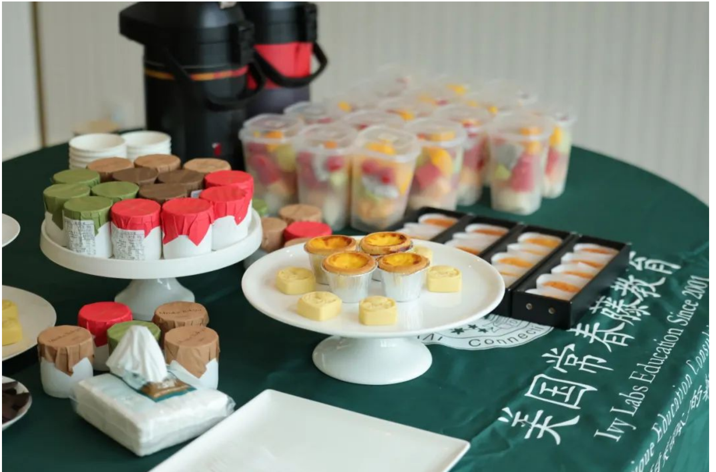
我们希望每一个参加活动的家长都能收获一段轻松、愉快同时收获满满的美好时光。