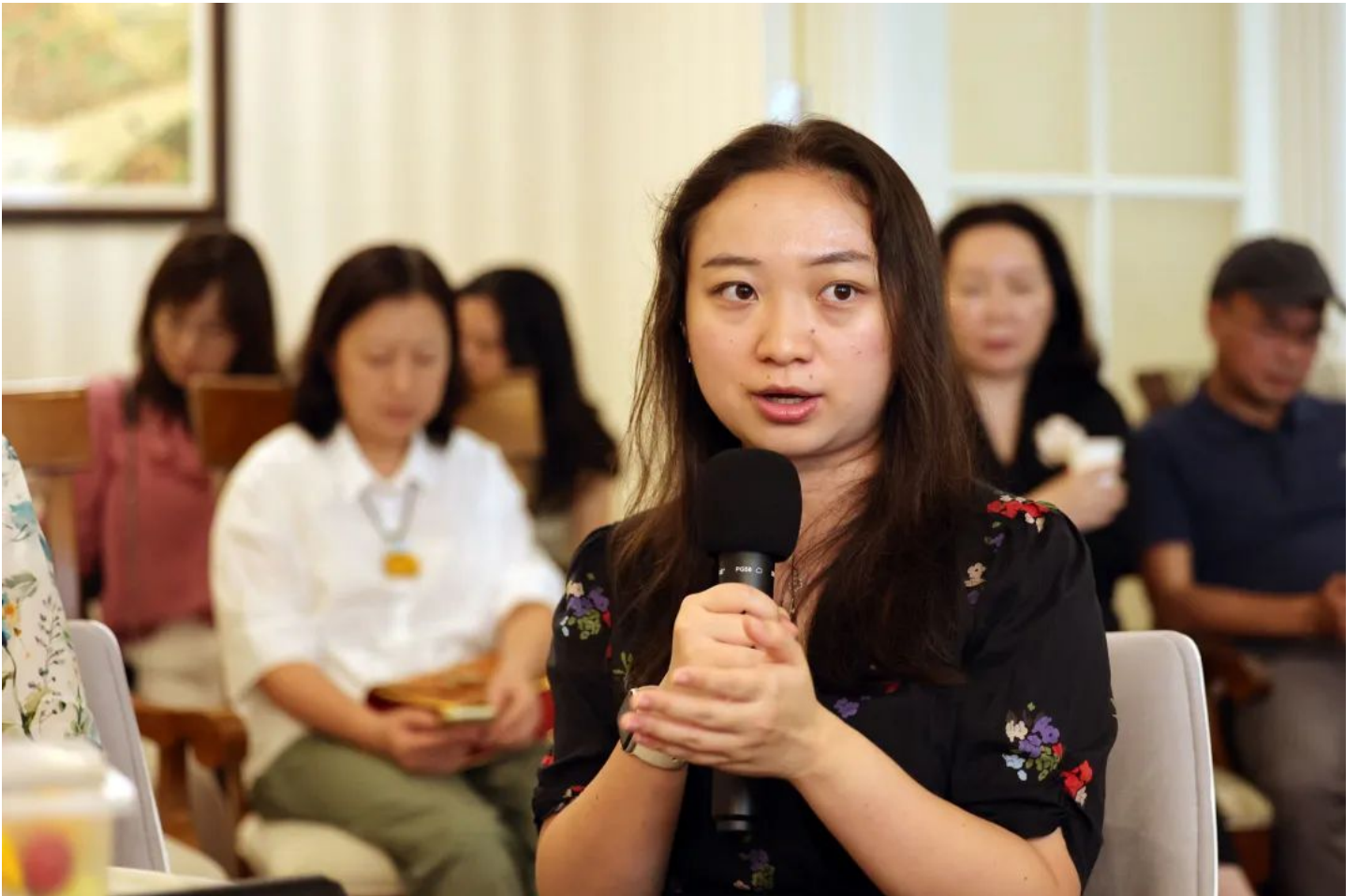
Melika老师：进入大学后的多元发展，关于转专业转学院的选择与做法