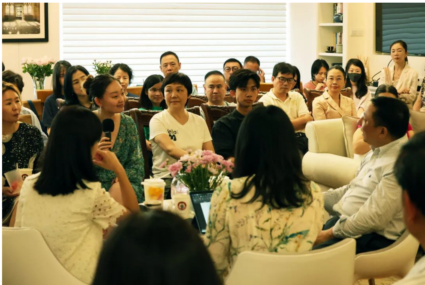
在庆祝Ivy Labs深圳办公室五周年的茶叙会上，老朋友们讲述着这些年与Ivy Labs共同成长的故事

于是，十月初章，4场真材实料、干货满满的Ivy Labs线下交流活动在北京、深圳、广州三地温馨展开。这些活动既是最新趋势的智慧探讨、宝贵经验的无私分享，更是新老朋友的欢聚交流、抚平焦虑的心灵对话。